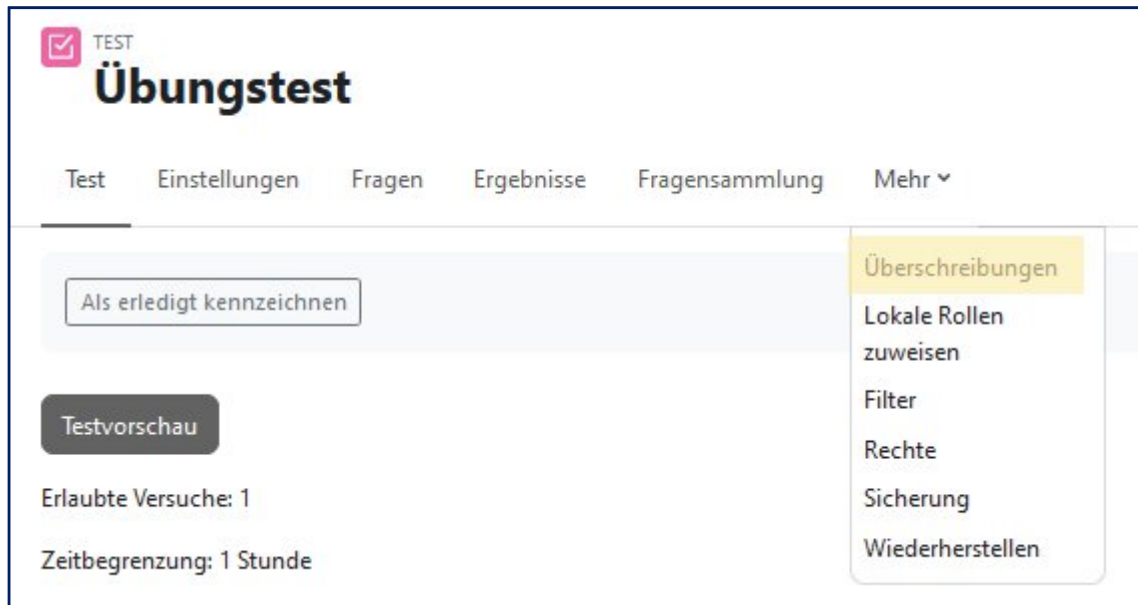
Abb. 3: Überschreibungen öffnen

Die Funktion „Überschreibungen“ kann über die mittlere Menüleiste im Test über „Mehr > Überschreibungen“ aufgerufen werden (siehe Abb. 3).